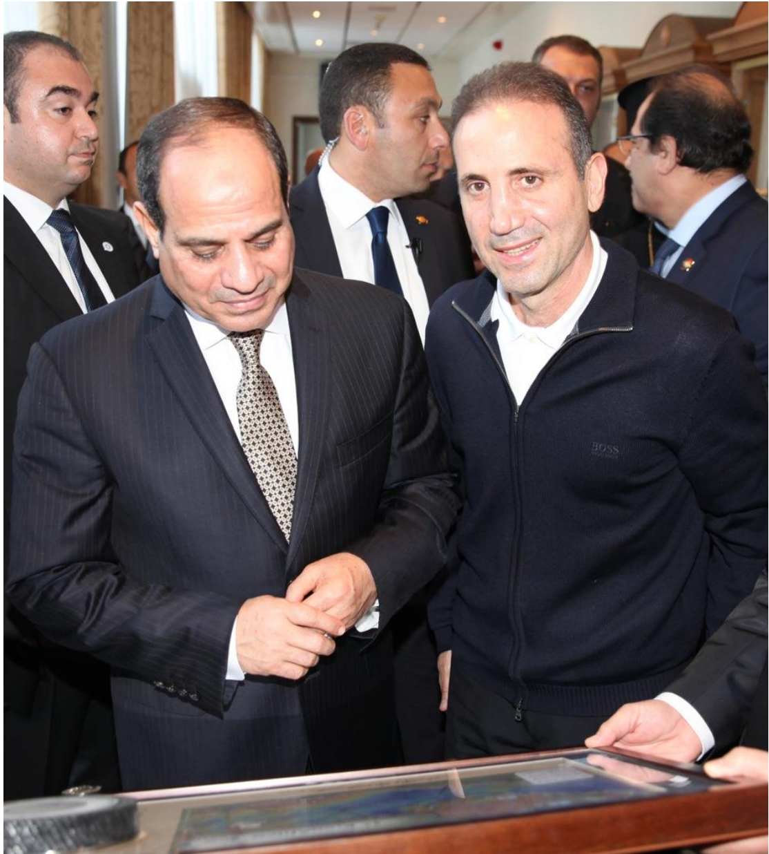
2. Ο πρόεδρος του EuroAfrica Interconnector, Νάσος Κτωρίδης, παρουσίασε στον Αιγύπτιο Πρόεδρο Αμπντέλ Φατάχ Αλ Σίσι το χάρτη της διαδρομής που θα ακολουθήσει το υποθαλάσσιο ηλεκτρικό καλώδιο.