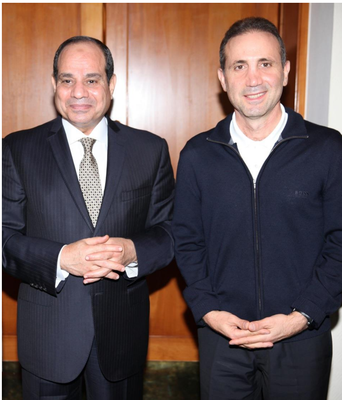
3. Ο Αιγύπτιος Πρόεδρος Αμπντέλ Φατάχ Αλ Σίσι και στα δεξιά ο πρόεδρος του EuroAfrica Interconnector, Νάσος Κτωρίδης